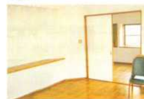
リフォーム前のリビング

これまではお仕事の関係で韓国暮らしをされ、その間、家は賃貸に。年1、2回の帰国時には利便性に優れたマンションで生活されてきました。定年後の住まいは、やはり庭がある一戸建て、しかもマンションの快適性を持つ家ということので、以前の家を全面リフォームされたI様ご夫妻。ご主人は、韓国での間仕切りのない部屋のゆとり感、オンドル（床暖房）の均一的な暖かさを取り入れたいとお考え。一方、奥様はご両親の介護経験からバリアフリーや廊下、トイレなど水回りの広さにこだわりをお持ちでした。そこで、ワンフロアで生活できるよう2階の寝室を1階に移し、しかもお互いが気を遣うことがないように、ゆるやかな別寝室スタイルに。吹き抜けの玄関ホールが寒いとのこと要望から、廊下の間にドアを設置。逆に内側の廊下とLDKには仕切りをなくして広々とした空間を作りました。LDKと洋室、寝室には床暖房を入れ、サッシをペアガラスや防犯ガラスにして断熱性、安全性を確保しています。「とても快適でエアコンの暖房はほとんどいらぬ」とご主人。奥様も「キッチンからの庭への開放感が心地よく、いつまでも安心して暮らせる家」とお気に入りです。