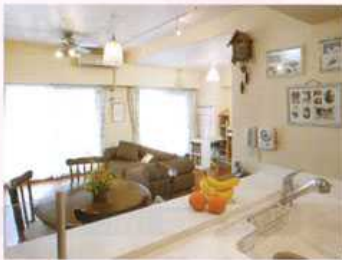
●工事期間=14日 キッチン=INAX/イスト