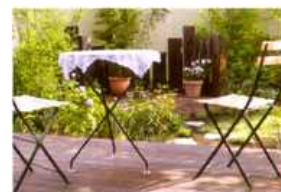
ダイニングから続く広いデッキのある庭